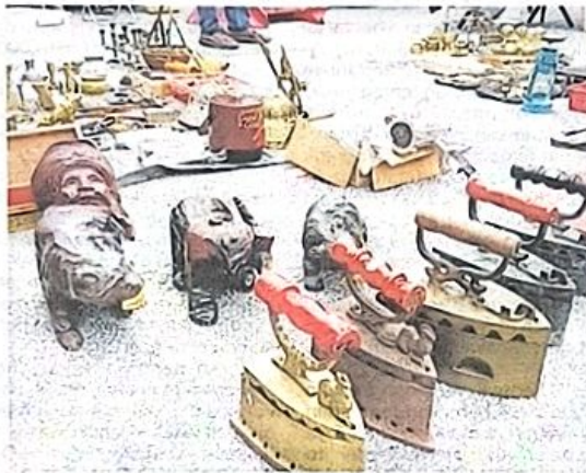
Antara barang-barang lama yang terdapat di pasar karat Jalan Utam Singh adalah seperti seterika antik tembaga.

"Saya juga ada teropong antik seperti yang digunakan oleh Jack Sparrow (watak dalam siri filem Pirates of the Caribbean ) berharga RM1,200. Teropong daripada tembaga ini dibuat di England dan mempunyai nilai