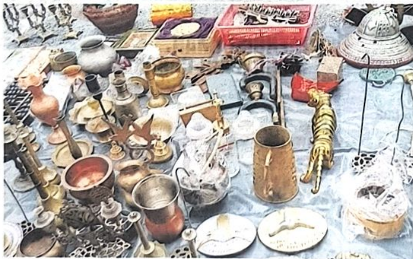
Pelbagai barangan antik dan vintaj ada peminat tersendiri yang mengumpul koleksi atau untuk dijadikan hiasan.

Pasar karat yang menampilkan lebih 20 peniaga itu dibuka pada setiap Ahad dari 7 pagi hingga 1 tengah hari. - Bernama