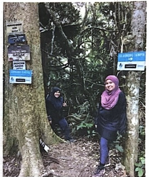
PENDAKIAN 'Trans Naning Reverse' menuntut kekuatan fizikal dan mental yang tinggi.

Kemudian, pendaki perlu meredah trek yang agak mencabar dan curam