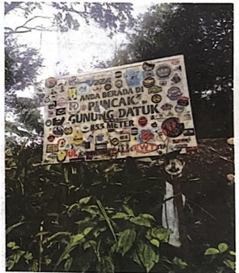
PUNCAK Gunung Datuk yang berjaya ditawan.