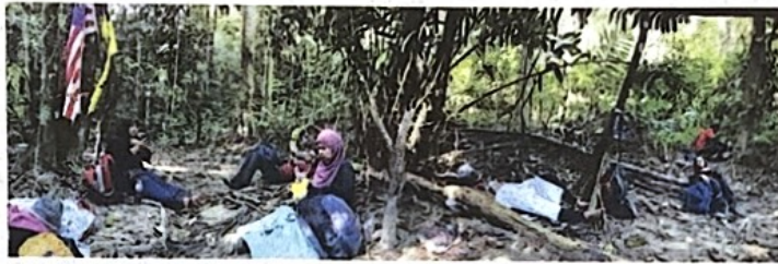
BEREHAT sebelum meneruskan perjalanan.