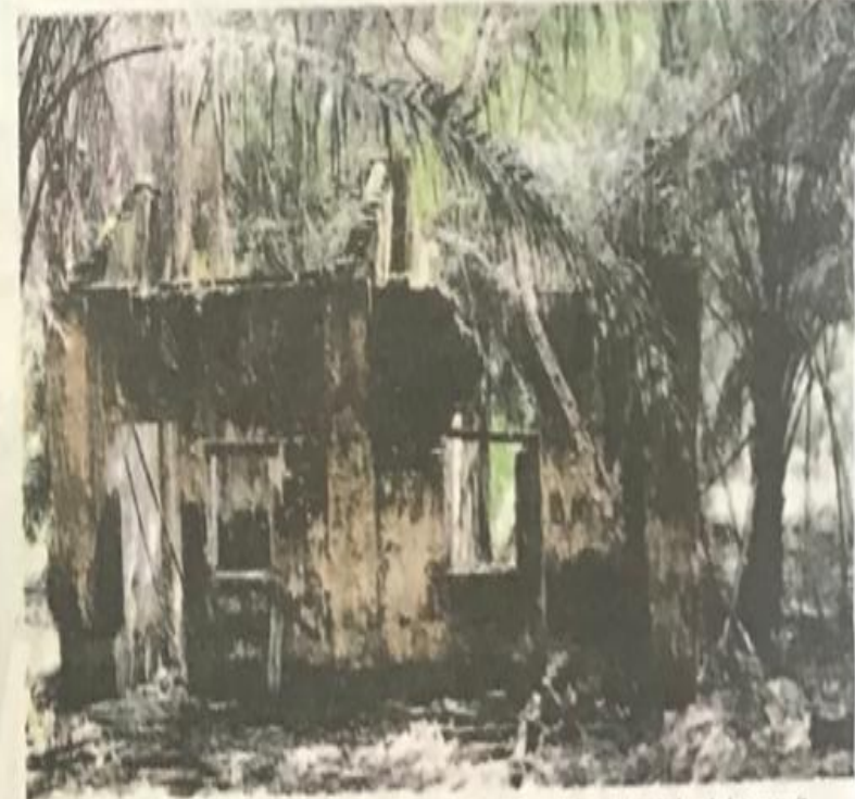
PENINGGALAN kuarter kediaman kakitangan Stesen Keretapi Ayer Hitam dalam kebun kelapa sawit.