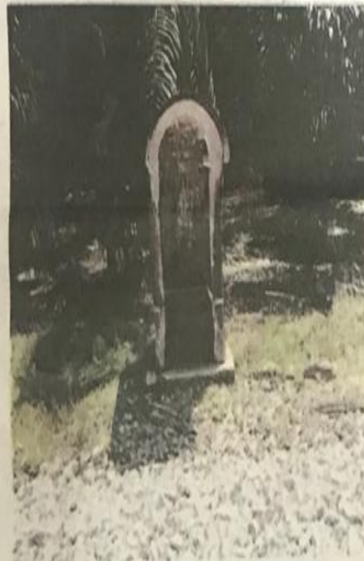
PONDOK kawalan isyarat stesen kereta api Ayer Hitam antara peninggalan yang masih ada.

empangan sebelum dirawat dan air bersih disalurkan kepada rumah pekerja ladang.