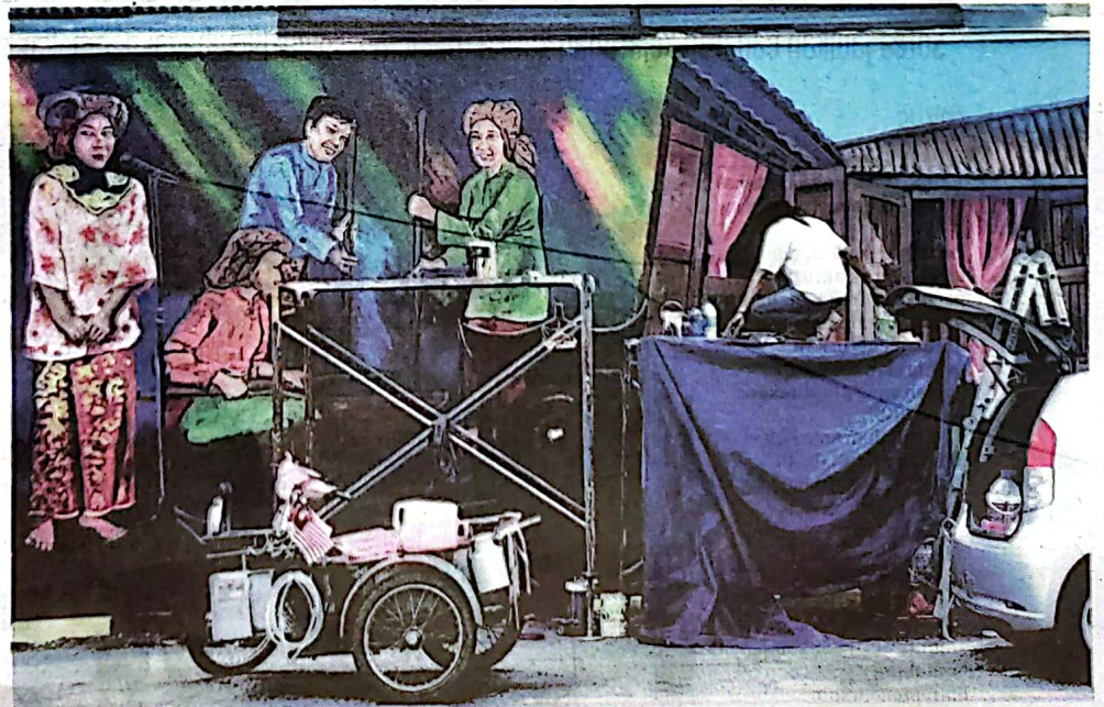
LUKISAN mural di Kuala Klawang menyetengahkan adat dan budaya daerah Jelevu.

Ia menerusi peruntukan dari Kementerian Pembangunan dan Kerajaan Tempatan (KPKT) selain membatikan agensi kerajaan di Jelevu, pihak swasta dan pertubuhan bukan kerajaan (NGO).