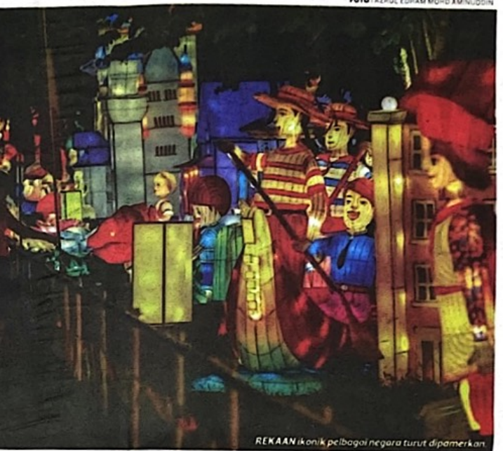
REKAAN ikonik pelbagai negara turut dipamerkan.