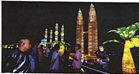
PESTA Lampu Antarabangsa Port Dickson berlangsung sehingga 15 Mac depan.

Difahamkan, lebih sejuta mentol lampu digunakan bagi